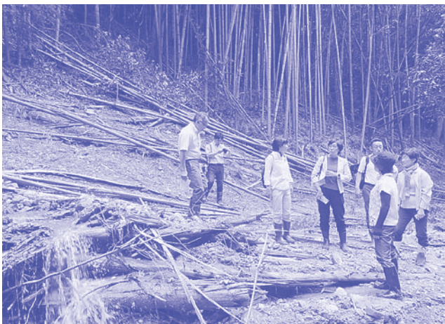
伏見区・小栗栖宮山地域の土砂崩れ現場