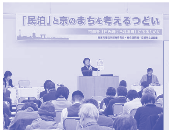
「民泊」と京のまちを考えるつどい (2018年1月27日)