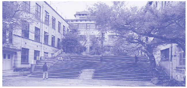
元清水小学校（東山）跡地はホテルに

法の活用」「市有地・民有地の産業用地としての積極的な活用」を明記。京都駅周辺の162%もの地域を「都市再生緊急整備地域」に指定し、企業が自由に開発提案できるように規制緩和。さらに、企業が「市有地・民有地」を全面活用できるようにする方針のもと