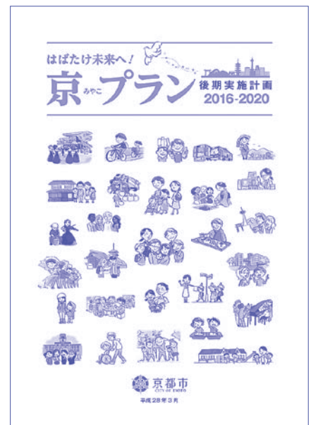
京プラン後期実施計画

企業に儲けの場を提供。③職員削減をさらにすすめ、民泊対応や税務部門の縮小など行政サービスは後退。職員は長時間労働を強いられ、交通局職員の長時間労働による過労自殺という痛ましい事態まで引き起こしています。職員の労働時間は、過労死ラインとされる80時間を超え、100時間の時間外勤務が発生するなど、市職員削減は限界に来ています。党議員団は、「京プラン」は市民の暮らしを守るという自治体本来の役割を投げ捨てるものとして厳しく批判。「京プラン」の撤回を強く迫っています。