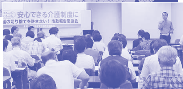
介護保険シンポジウム