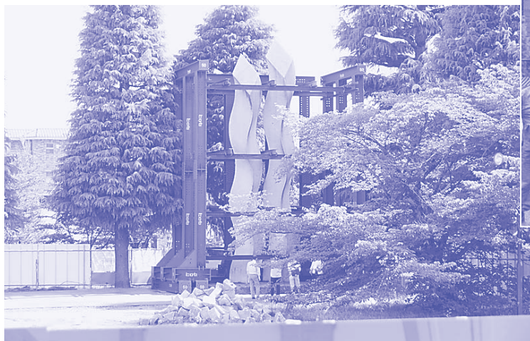
モニュメント「空にける階段 '88-Ⅱ」