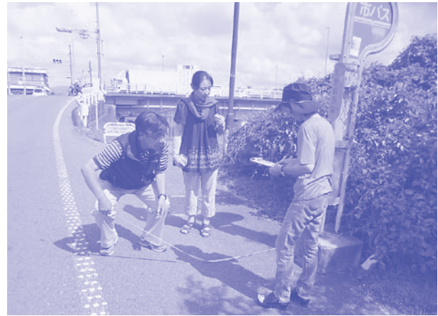
バス待ち環境を調査する党議員

「市バスをもっと通してほしい」との要望を受け議会でくり返し取り上げてきました。伏見区など市バスの増便、新系統実現。ベンチや上屋などバス待ち環境の改善。市内均一区間拡大など市バスの利便性の向上、民間バスの施設改善補助制度の実現、地下鉄烏丸線3駅で転落防止柵を実現しました。2017年3月、阪急西院・嵐電西院駅を結ぶ通路と同時にエレベーターの供用が実現。「地下埋設物が多い」「駅構造上困難」といわれながら20年。「住みよい西院学区をつくる会」の皆さんと、署名に取り組むなど粘り強い運動と議会での論戦が実ったものです。