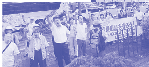
「敬老乗車証を守れ」集会

敬老乗車証制度の改悪方針の提案から5年間にわたって改悪実施を許していません。「守ろう敬老乗車証連絡会」と共同してキャラバン宣伝、集会デモにくり返したりくみましました。「連絡会」は3万7000筆の署名を提出。また、「連絡会」は1ヶ月にわたって「敬老乗車証をどれだけ活用したか 家計簿アンケート」を実施。こうした運動が力となり、議会で党議員団がくり返し取り上げる中で、市長は「応益負担の改悪」には触れず「制度は残す」と答弁。改悪実施に踏み切れない状況を作り出しています。