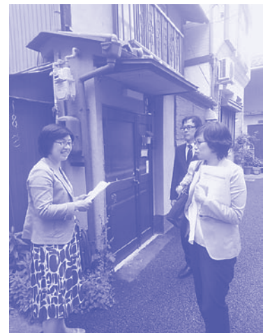
東山区での民泊実態調査