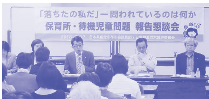
党議員団主催 保育所・待機児童問題報告懇談会

利条例制定」に向け、「京都子どもネット」が発足し、子どもの実態告発のシンポなどが開かれています。