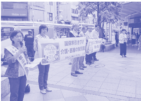
「みんなのいのちを守る署名」行動