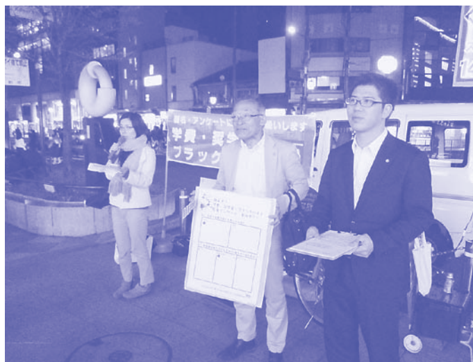
LDA-KYOTOと共に宣伝する党議員

LDA-KYOTO（生きやすい京都をつくる全世代行動）の皆さんと一緒にブラック企業・ブラックバイトの実態調査を実施、市に対策を求めました。市長も「ブラックバイト・ブラック企業根絶」を表明。京都府・京都市・労働局の三者でブラックバイト対策協議会を発足させ、実態調査、相談窓口設置、大学のオリエンテーションの資料に働くルールを入れることなどが実現。またLDA-KYOTOの皆さんと給付制奨学金の実現を求める運動と論戦にとりくんできました。議会でも「給付制奨学金の創設を求める」意見書が全会一致で採択されました。