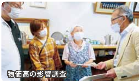
物価高の影響調査

物価高騰の影響について訪問・ききとりを行い、暮らしと営業を守るための緊急対策を2度にわたり求めました。