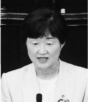
西野 さち子 議員

西野さち子議員は、5月21日に開かれた本会議で、日本共産党を代表して質問を行いました。