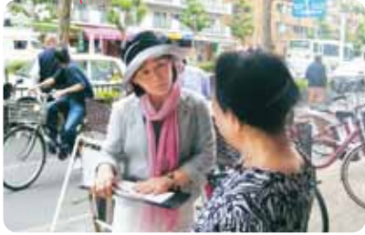
●署名行動で、要望を伺い対話

「敬老乗車証は大切に使っています。1回乗るたびに100円なんて困ります。よろしくお願います」と、たくさんの方が署名にご協力いただき、切実な声を寄せていただきました。