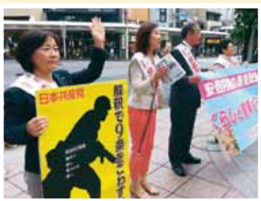
●河原町三条で宣伝(左端)

安倍政権がすすめる「海外での武力行使」を可能とする動きは、自衛隊が軍隊となり、徴兵制の道につながります。今後、子どもたちが銃を持ち、殺し殺される戦地に行くことのないように、平和の日本を子どもたちに残しましょう。支持政党のちがいを越えて、多くの方と手をつなぎ、取り組むたいと決意しています。