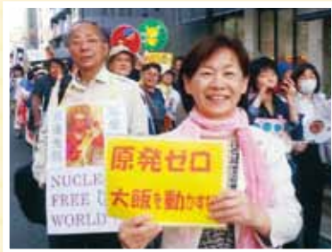
●関電前行動に参加

福島原発の事故により、原発が危険で人間の手には負えないことが明らかになった今、私たちが、子どもたちの未来のために、行動しなくてはならないと思います。ぜひ、一緒に声をあげましょう。