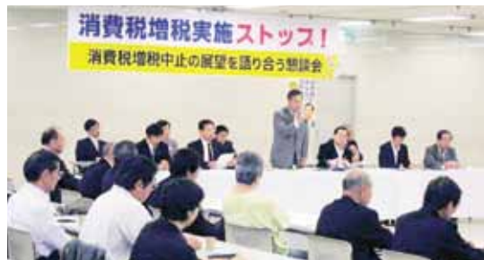
「消費税増税中止の展望を語り合う懇談会」(10月17日・西陣織会館)