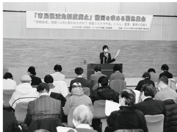
「市民税減免制度廃止」撤回を求める緊急集会（12月8日）

減免制度廃止の中止を求める署名は、短期間で1000筆を超えて寄せられました。市長が諮問した「行財政審議会」では、市民生活のあらゆる分野でのサービス切り捨て、負担増の押しつけが議論されています。減免制度の廃止撤回をはじめ、「自助」の押しつけを許さない市民の声を一層広げましょう。