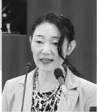
森田 ゆみ子 議員

森田ゆみ子議員は、12月1日に開かれた本会議で、日本共産党を代表して質疑を行いました。