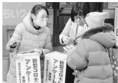
ハローワーク前で取り組んだ 雇用アンケート (12月21日～23日)