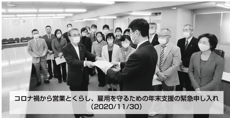
コロナ禍から営業と暮らし、雇用を守るための年末支援の緊急申し入れ (2020/11/30)