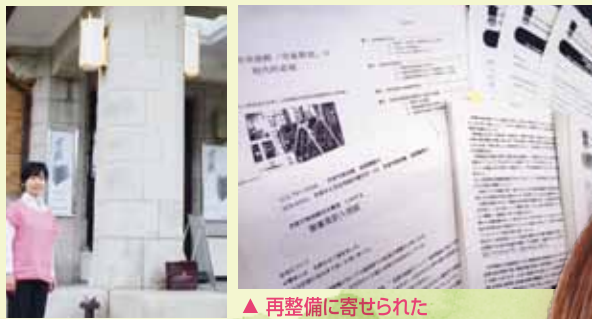
▲京都市美術館を視察

市民アトリエ棟（喫茶店横）廃止問題で利用7団体のうち、塑像、銅版画が継続の危機に。私は「市民アトリエ存続を」請願の紹介議員になり、「1958年にパリ市との姉妹都市締結の記念にスタートし、50年も続く、誇るべき活動だ。なぜ京都市の財産である文化芸術活動への支援を弱めるのか」「新たに整備する予定の『ワークショップ』はきっかけづくりの場、その後の活動応援がいる」と、委員会で質しました。