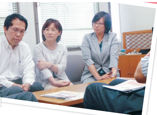
●教育委員会制度改悪ストップ アピールなどを京都市に申し入れ (6月9日)