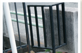
●浄土寺小橋の鉄柵 さびつき傷んでいたもの を取り替え。