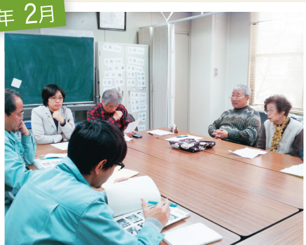
行政などに要望し、実現へ