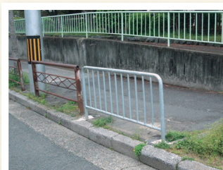
●プランター撤去 と鉄柵新設