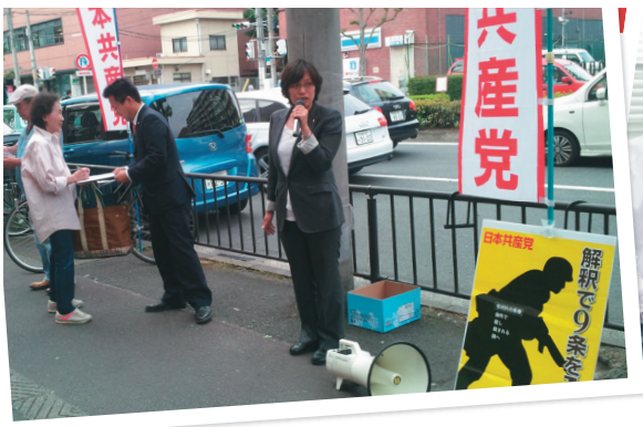
●集团的自衛権 「戦争する国づくり」はダメ! (5月25日)