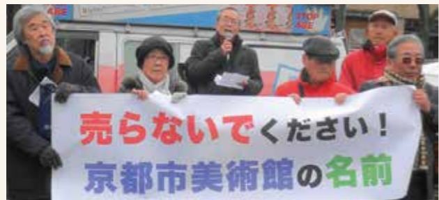
市役所前で 抗議行動

企業のPRに使う権利を与えるネーミングライツの売却は撤回し、再整備計画を見直すべきです。