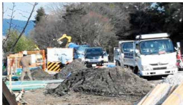
景観を破壊する二条城北西角の第2駐車場建設 (伐採・移植された樹木は約90本)