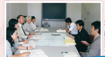
駅や市営住宅をバリアフリーに

「これがあるから病院に行ける」「ホンマにありがたい」と喜ばれる敬老乗車証を、市は「乗るたび負担する制度」に変える方針です。私は民間バスにも敬老乗車証が使えるようにずっと求め続けます。