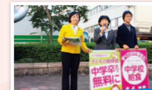
いのち・暮らし最優先に

「駅の階段がづらい」「エレベーターがほしい」という声を阪急本社や市に伝え、駅や市営住宅のバリアフリー化を求めてきました。上桂・松尾大社・嵐山駅で計画進行中。榎原市営住宅はエレベーター設置が決定。早期の改善に力を尽くします。