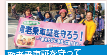
敬老乗車証を守って民間バスにも使えるように

「バス停にベンチや上屋・バスロケの設置を」「区役所や福祉センターへのバスを」「循環バスを」「運賃下げて」の要求実現を迫ってきました。生活の足である市バスをもっと便利にするためにがんばります。