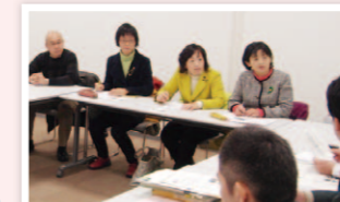
バスをもっと便利に

高齢者・障害のある方や地元で利用され喜ばれていた施設。存続を求める声を聞かず廃止を決めた市に、「存続せよ」と求めてきました。誰もが利用できる会館が必要です。