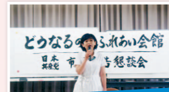
洛西ふれあい会館廃止しないで

高齢者・障害のある方や地元で利用され喜ばれていた施設。存続を求める声を聞かず廃止を決めた市に、「存続せよ」と求めてきました。誰もが利用できる会館が必要です。