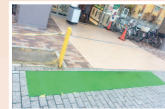
千本ライフ前の歩道の敷石のデコボコの改善を西部土木事務所に要望