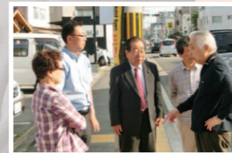
西小路旧二条通の通学路安全のため、歩道設置を住民のみなさんと警察に要望