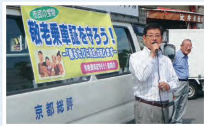
敬老乗車証守ろう宣伝