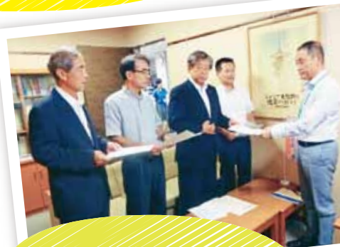
台風11号と豪雨災害対策で京都市に申し入れ(8月22日) 「制度・活用リーフ」を作成